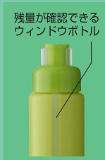
残量が確認できる ウィンドウボトル